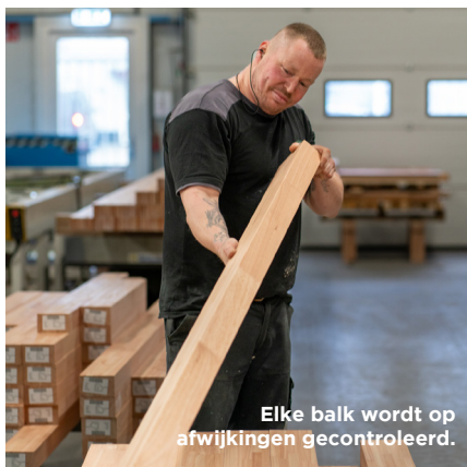
Elke balk wordt op afwijkingen gecontroleerd.