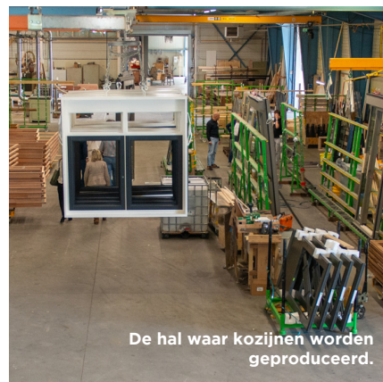
De hal waar kozijnen worden geproduceerd.