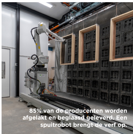
85% van de producenten worden afgelakt en beglaasd geleverd. Een spuitrobot brengt de verf op.