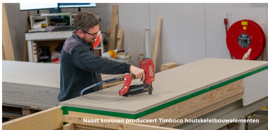
Naast kozijnen produceert Timboco houtskeletbouwelementen